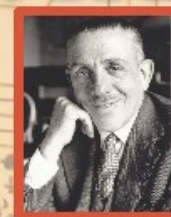
• Francis Poulenc •