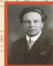
• Ottorino Respighi •