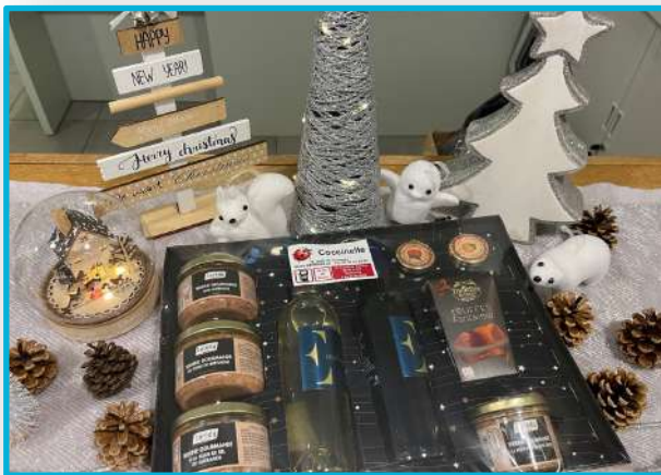
Colis pour les personnes de plus de 65 ans de Bernaville.