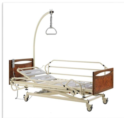
PHOTO LIT MEDICALISE