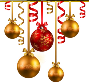
Colis pour les personnes de la MARPA