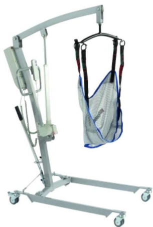
PHOTO LEVE MALADE

Les AVS sont pour la plupart prestataires et mandataires.